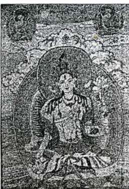
«Сагаан Дара эхэ»