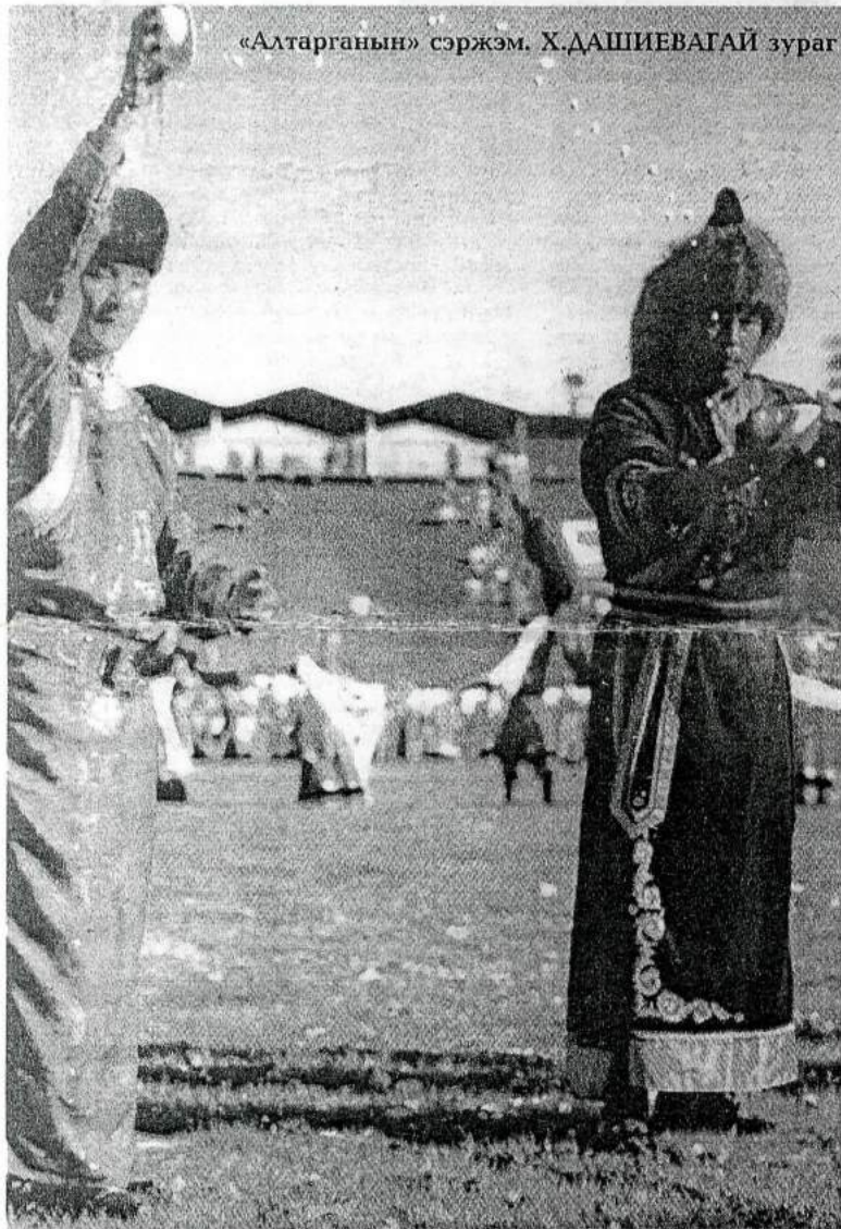
«Алтарганын» сэржэм. Х.ДАШИЕВАГАЙ зураг

Гурбан үдэрэй туршада уласхоорондын буряад арадай «Алтаргана» гэнэн фестиваль Эрхүүгэй газар дайдада эмхи гуримтайгаар үнгэргэгдэбэ. Буряад ороной делегаци энэ хэмжээ ябуулгада түлөөлэгэ эхэтэй байба.