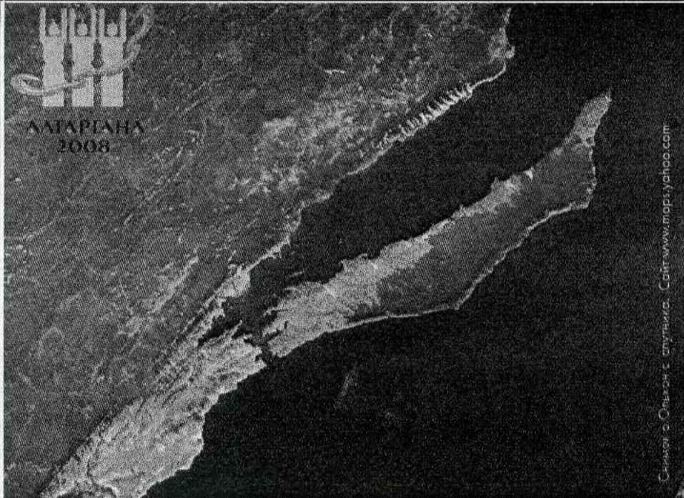
Снимок с Ольхон с спутника.

В рамках Международного всебурятского праздника «Алтаргана-2008» на Ольхоне проводятся массовые народные игры, молебны в честь древних божеств бурят-монголов. Ольхон-арал (остров Ольхон) и Приольхонье - прародина многих бурятских племён, прежде всего хори-бурят - богаты историческими памятниками.