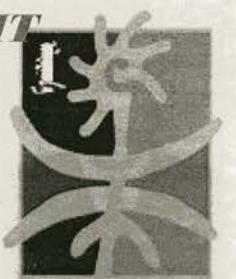
BURYAT-MONGOLIAN FESTIVAL ALTARGANA БҮРЯАД-МОНГОЛШУУДАЙ НААДАН

Мүн «Алтаргана» гэжэ нэрэнь онсо удхатай. Алтаргана хадаа талада ургадаг сээг гээшэ. Тэрэний үндэһинийг уһа бэдэржэ, газар доосо ороһон байдаг, хэды ган болобошы, шара үнгөөр сээг гээдэг. Тон буряад угсаатантай ади. Хэды хүндэ орбо сагта ажаһуувабыш, хэды хаана нана хаягдабыш, буряадууд үндэһин соёлоо, уг гарбалаа, ёһо заншалаа алдаагүй гэгэн удхатай юм.