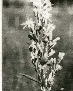
ЗОЛОТАРИК ОБЫКНОВЕННИЙ (ЗОЛОТАЯ РОЗГА) - Solidago L. (Солрозная Розга)

Семейство астровые (двухответветные) - Asteraceae Dumort. (Солрозные Астры)