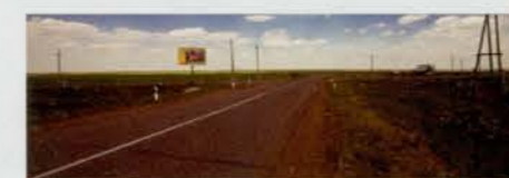
Поворот налево к с. Черемушки