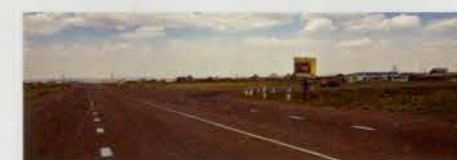
Поворот направо с Качугского тракта