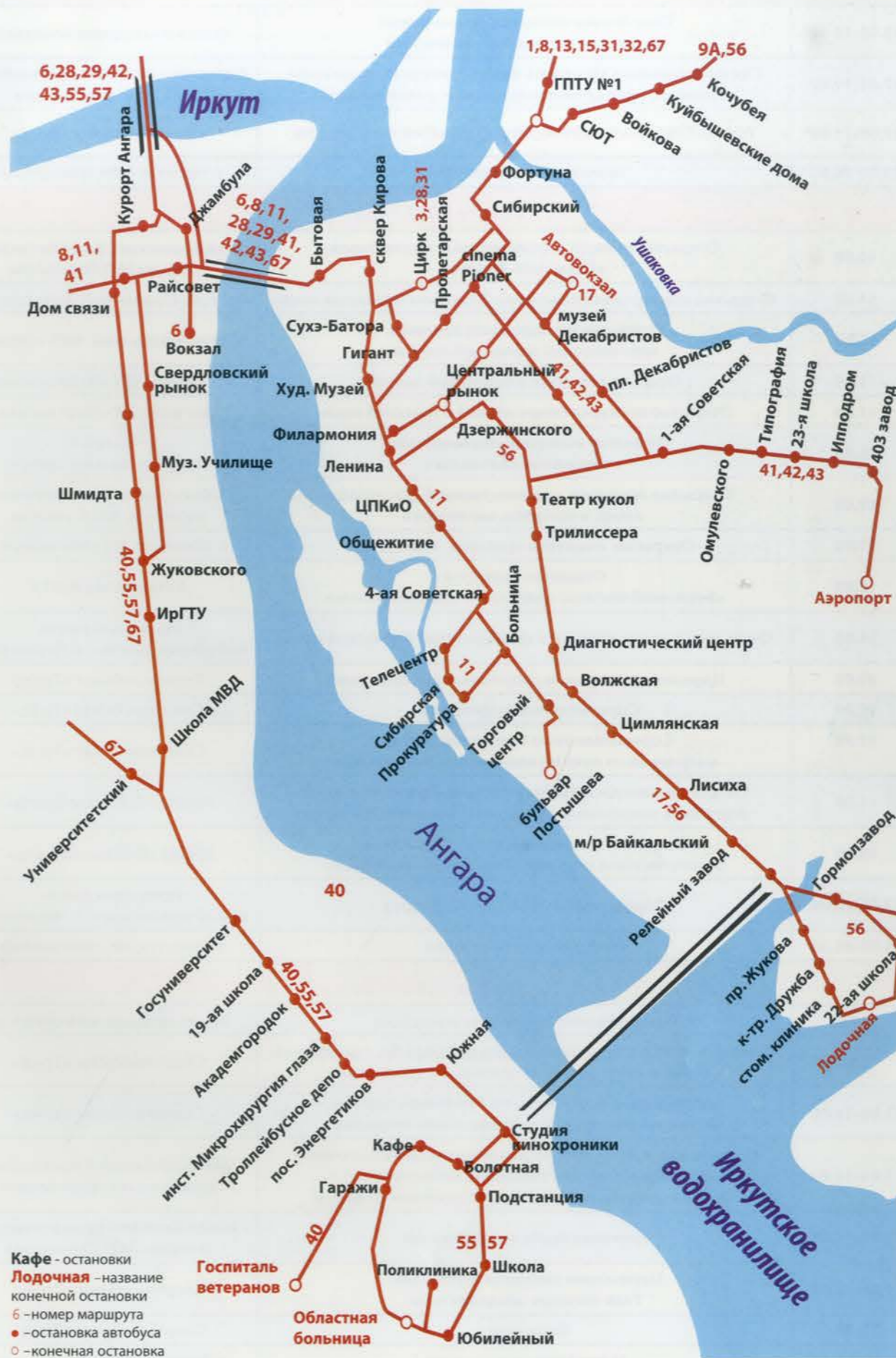
Схема маршрутов движения муниципальных автобусов