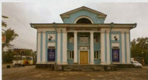
Театр кукол «Аистенок»

г. Иркутск, театр кукол «Аистенок» – Открытие конкурса журналистских материалов «Алтан саг» (остановка транспорта «Театр кукол», либо пешком от спорткомбината «Труд» 20-25 мин);