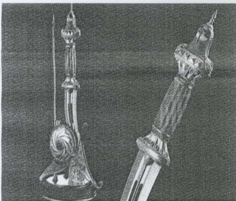
Настольная композиция «Воин»